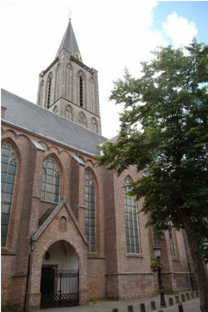
De Utrechtse Jacobikerk.